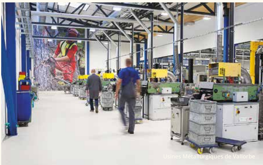
Usines Métallurgiques de Vallorbe